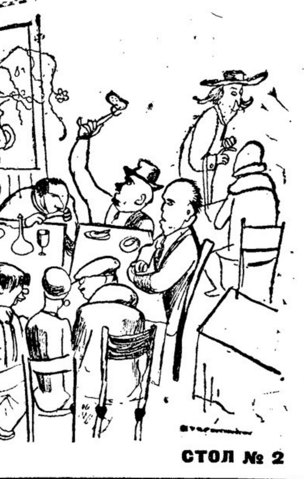
СТОЛ № 2

... Наме всего «смычка» происходит... в столовой дома Герцена.