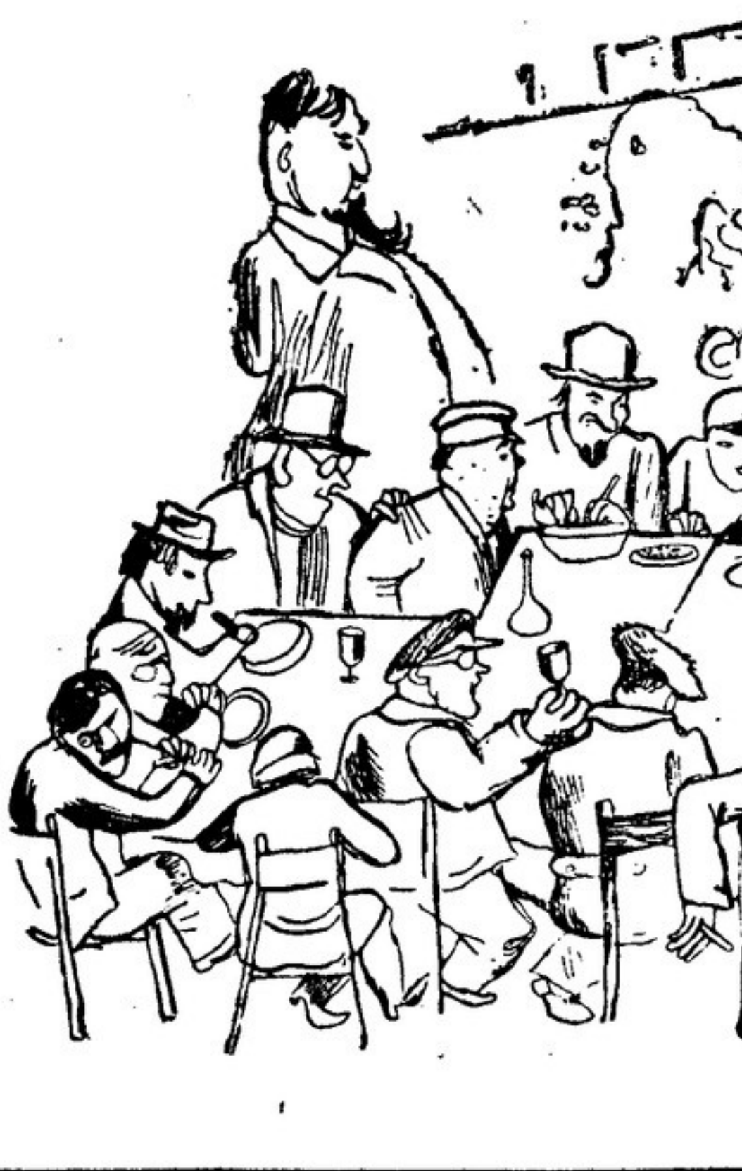
СТОЛ № 2

... Наме всего «смычка» происходит... в столовой дома Герцена.